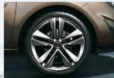
8 Легкосплавные колесные диски, 7.5 J x 18, 5-двойных спиц, шины 225/40 R 18.