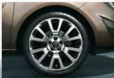
9 Легкосплавные колесные диски OPC Line, 7.5 J x 18, 5-двухцветных спиц, шины 225/40 R 18.