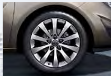
7 Легкосплавные колесные диски, 7 J x 17, 10-спиц, шины 225/45 R 17.