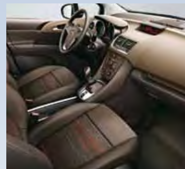
Отделка Skyline/Atlantis, цвет-бежевый.