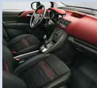
Отделка Skyline/Atlantis, цвет-красный/черный.