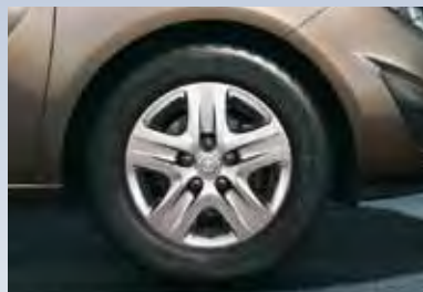
2 Структурные колесные диски, 6.5 J x 16, 5-спиц, шины 205/55 R 16.