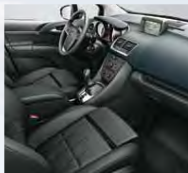
Кожа Mondial 1 , цвет-черный.