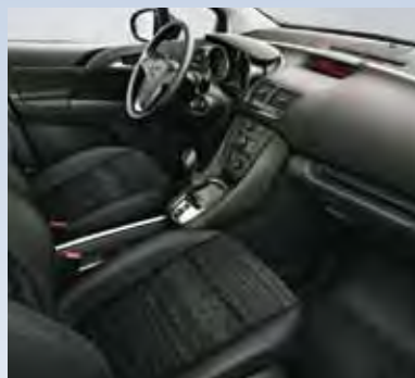
Отделка Skyline/Atlantis, цвет-черный.