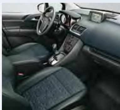
Отделка Astor/Siena, цвет-синий/черный.