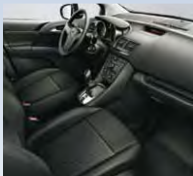
Отделка Pere/Atlantis, цвет-черный.