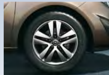
4 Легкосплавные колесные диски, 6.5 J x 16, 5-двойных спиц, шины 205/55 R 16.