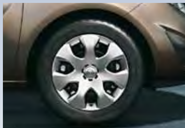
1 Стальные колесные диски с колпаками, 6.5 J x 15 и 6.5 J x 16, 7-спиц, шины 195/65 R 15 или 205/55 R 16.