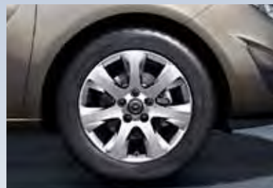
3 Легкосплавные колесные диски, 6.5 J x 16, 7-спиц, шины 205/55 R 16.