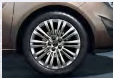
5 Легкосплавные колесные диски, 6.5 J x 16 и 7 J x 17, 10-двойных спиц, шины 205/55 R 16 или 225/45 R 17.