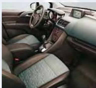
Отделка Astor/Siena, цвет-светло-зеленый/бежевый.