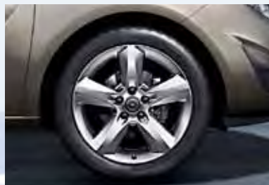
6 Легкосплавные колесные диски, 7 J x 17, 5-спиц, шины 225/45 R 17.